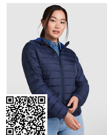
NORWAY WOMAN RA5091